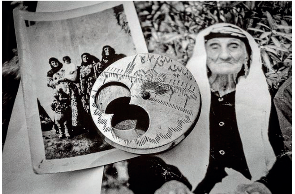
La tabatière de Serpouhie. « Cette tabatière porte le souffle de ma mère, et je voudrais qu'elle retourne dans une famille arménienne »